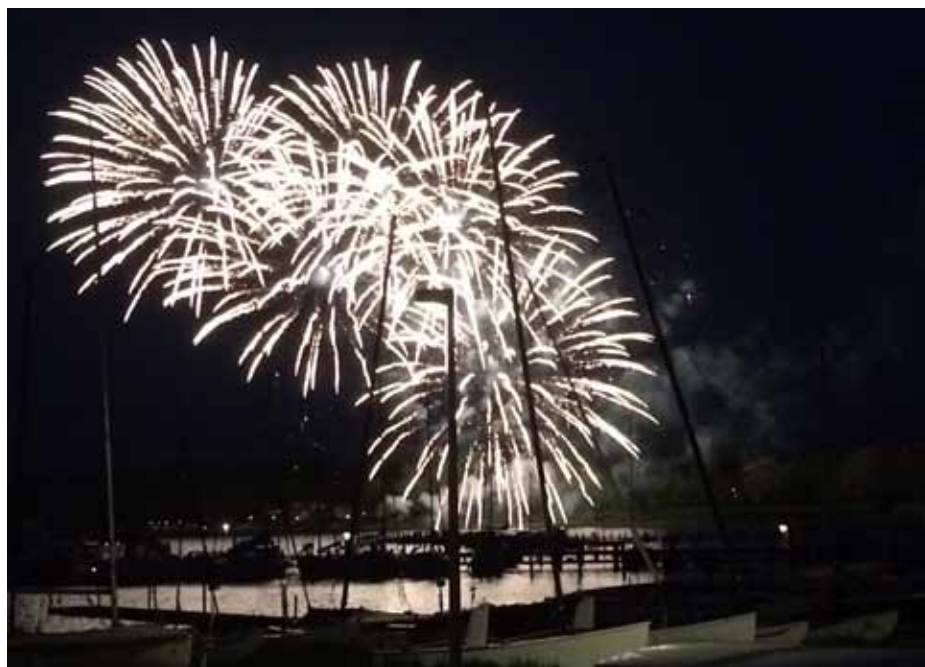
"Nordlys" over Gamborg Fjord

Herlighetene står i kø nå - bruk dem - hjertelig W-hilsen og 'Happy Sailing' !