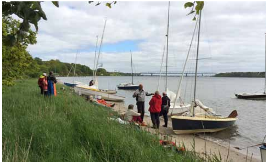
Frokost ved Børup Sande

Vi satte fok og rebet storsejl og havde en frisk og lidt våd, men egentlig tryk sejlad op gennem Fænø Sund til den anden side, hvor vi lagde til i læ af kystskrænt og skov.