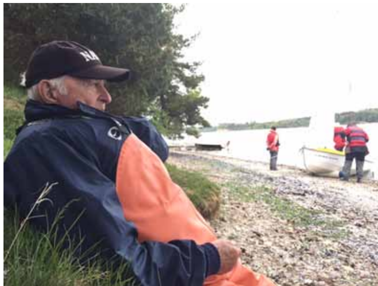
Forfatteren i en afslappet stund

Flot sejlvejr og første dag X-på-X til hovedlandet/Jylland (ret Vest for den gamle lille Bælts Bro som man nu kan gå opover - tar 2 ca. timer) hvorfra de fleste deltagere kom. W1740 'RAS' med Jens Konge og Fru Inge viste vej til en herlig læ-strand, hvor der blev frokost/lunsj-ophold.