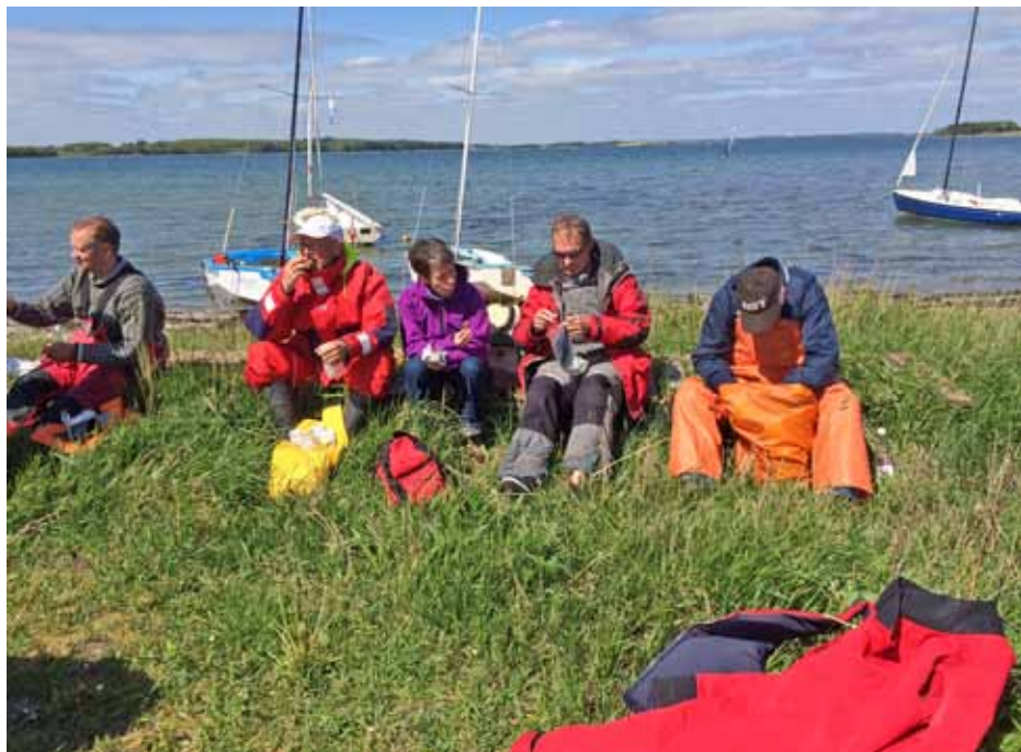
Frokost ved Ronæs i bunden af Gamborg fjord.