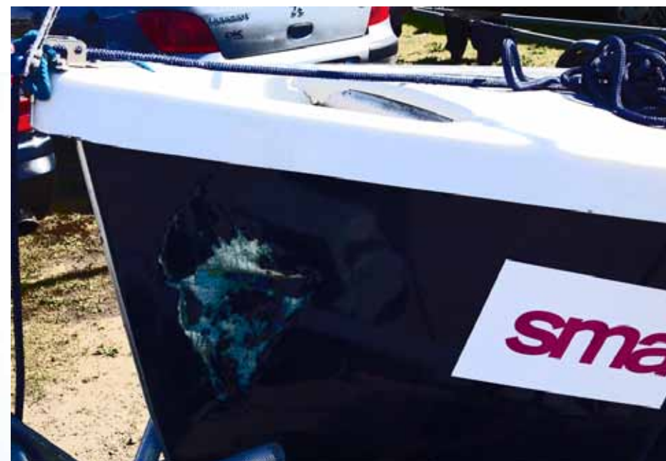
Hullet i skroget

Heldigvis var begge både forsikret hos Pantaenius, og i øvrigt var der ikke tvivl om ansvaret. Båden blev repareret i løbet af 2-3 uger og så vi var klar til næste stævne i Esbjerg. Reparationen er i øvrigt lavet så flot at der ikke er spor af skaden.