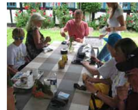
Kaffe og kage på Gammel Elmegård

Efter gyngeturen er der kaffe og is i rosenhaven hos de to søstre på "Gammel Elmegård" på Drejø. Det er et vidunderligt sted, hvor is, kager, kaffe og serveringen er helt i top, og bestemt et "MUST", når vi er på Rantzausminde.